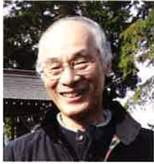
アール・ブリュット・フェスティバル 2018