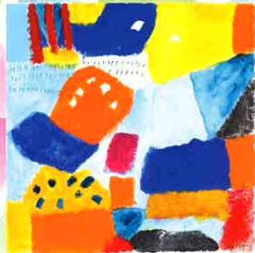
佐野 ぬい 洋画家/ 女子美術大学名誉教授