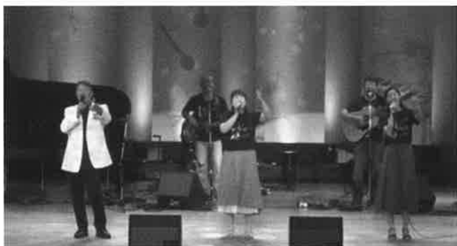
2019年コンサート風景