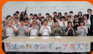
学生サークル 「長崎多職種連携・たまごの会」